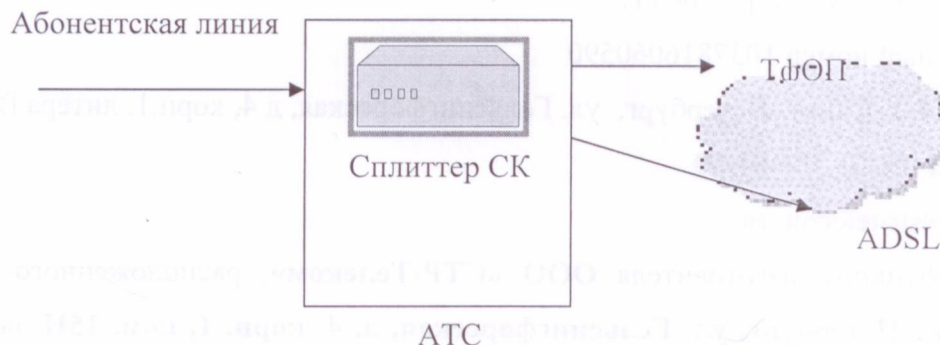
Схема подключения изделия к телефонной сети общего пользования

В изделии программное обеспечение не используется.